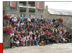
Photo de groupe devant le Théâtre de Dinan réunissant organisateurs, stagiaires et facteurs de harpe

Les trois nouvelles harpes celtiques de SALVI présentées pour la première fois