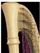
style 85 GC

Les harpes Lyon&Healy ont un son caractéristique, puissant et brillant. Leur capacité à « projeter » le son en font des instruments appréciés des harpistes d'orchestre. Listes de prix disponibles sur demande.